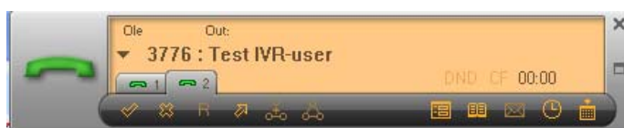
Pop-up bilde viser pågående samtale og aksjonsknapper